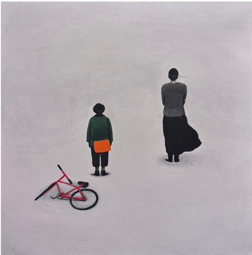
É IN MOTION No.2 2026 273x273 mm (S3) Acrylic on Panel

文化庁メディア芸術祭大賞受賞作品「浮楼」、DOMANI展（2015）にて大絶賛を浴びた「É IN MOTION No.2」、