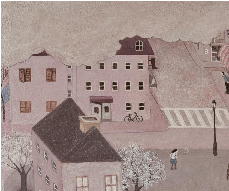
Flow 2026 380 x 455 mm (F8) Acrylic on Panel

YUKI-SIS では、5月16日(土) - 30日(土) 榊原澄人個展 - WORKS ~ 2026 - " を開催いたします。