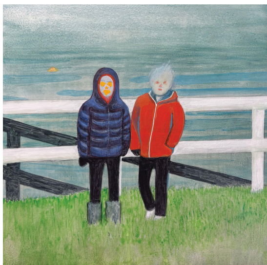
飯縄縁日 ふたり 2026 180x180mm Acrylic on Panel

It is often said that people are first drawn to what most interests them. In Sakakibara's animations, countless characters move simultaneously across the screen. Among them, which figure will capture your gaze?