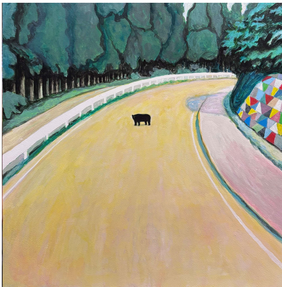
子どもたちの霊歌より 2026 273x273 mm (S3) Acrylic on Panel

In 2021, his work Iizuna Fair was unveiled as the inaugural exhibition following the reopening of the Nagano Prefectural Art Museum and continues to be shown there as a permanent installation. The work has since received numerous awards and invitations from animation festivals around the world, further establishing Sakakibara as an animation artist of international acclaim.