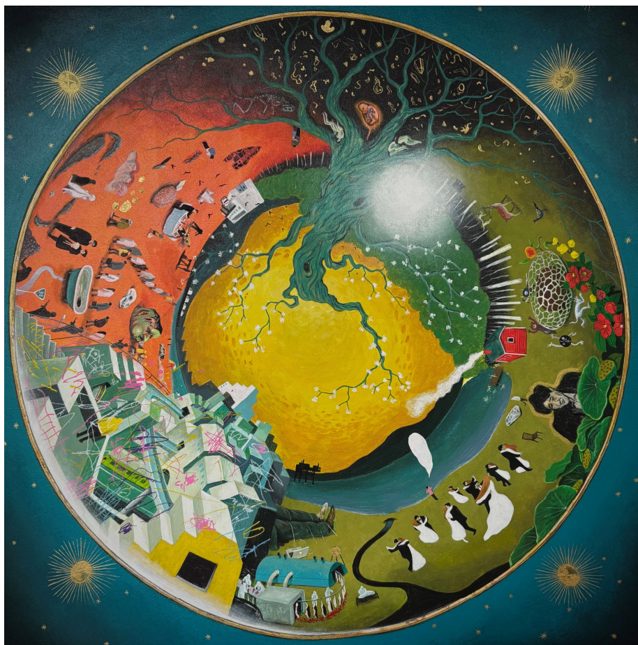
Solitarium 2026 410x410mm (S6) Acrylic on Panel

榎原の作品においてループされるのは、一見しては捉えにくい、人間やその行為の内面です。それは直接的に描かれるものではなく、微かな差異や、語られる状況の中で反復されるうちに、徐々に浮かび上がってきます。