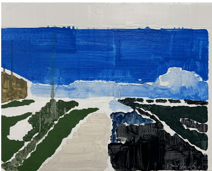
Landscape 2025 32×41cm Oil on Canvas