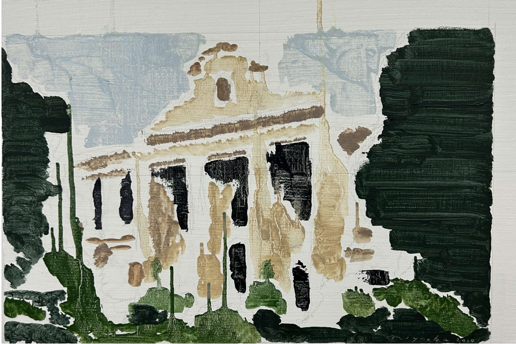
Landscape 2024 24×41cm Oil on Canvas

In addition to solo exhibitions in Osaka and Kyoto, as well as Tokyo, he has exhibited at many art fairs in Beijing (China), Bologna (Italy), Chicago, San Francisco, and Seattle (U.S.) In 2017, he received the Yomiuri Shimbun Award at the FACE Exhibition 2017, Sompo Japan Nippon KOUA Art Award Exhibition. Currently, he has moved his activities to Izumo City, Shimane Prefecture.