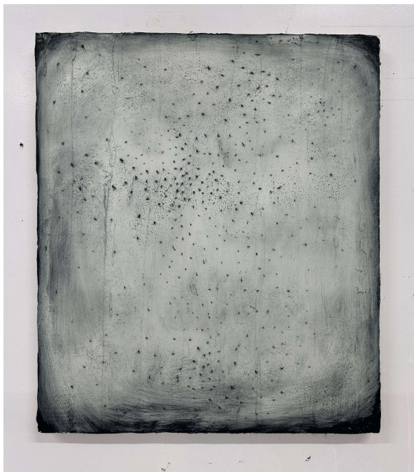
"Moonlight - Landscape" 2024 53x45.5cm Oil on Canvas