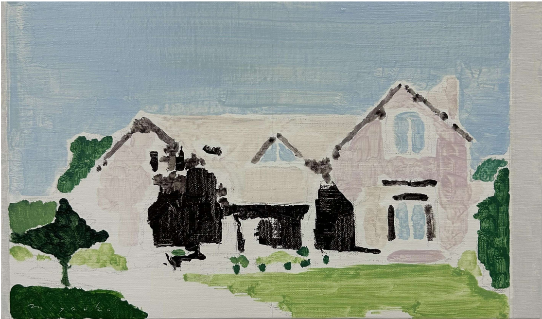
Landscape 2024 24×41cm Oil on Canvas