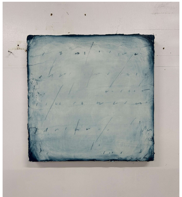
"Moonlight - Landscape" 2024 33.5x33.5cm Oil on Canvas