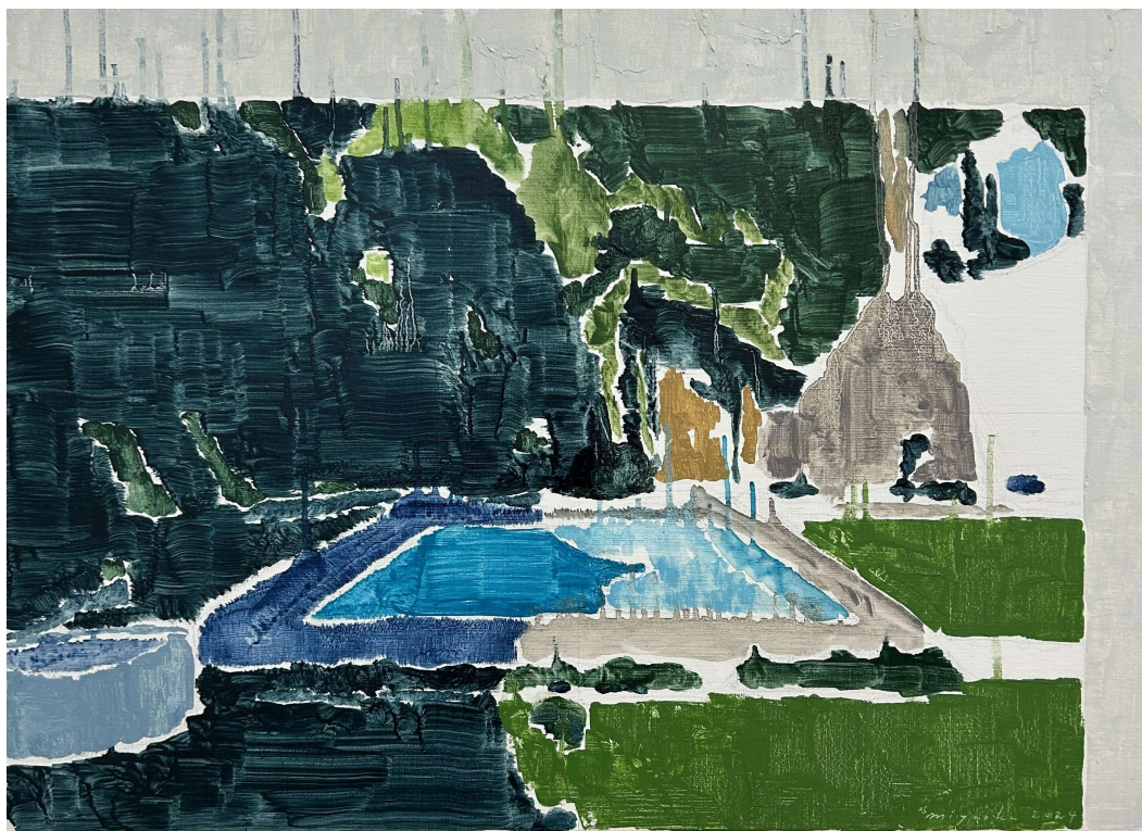
Landscape -Pool- 2024 53.0 x 73 cm Oil on Canvas