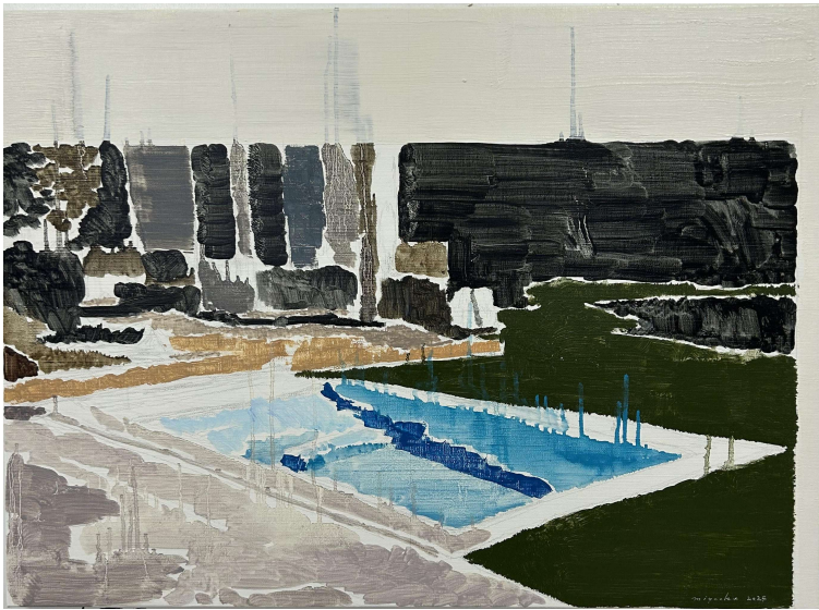
Landscape-Pool- 2024 53×73cm Oil on Canvas