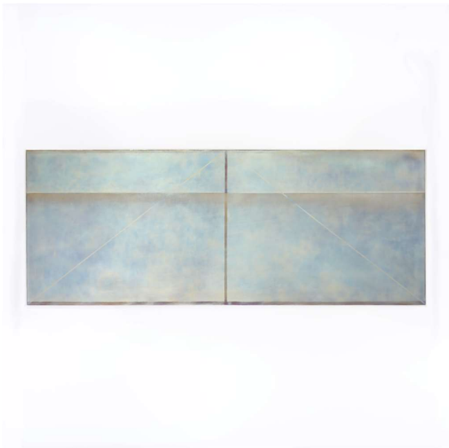
2022 364×937 mm Titanium

約2年半ぶりの今回の展覧会では、ギャラリー内が静寂と瞑想の空間となり、私たちを包んでくれることでしょう。ぜひご覧ください。