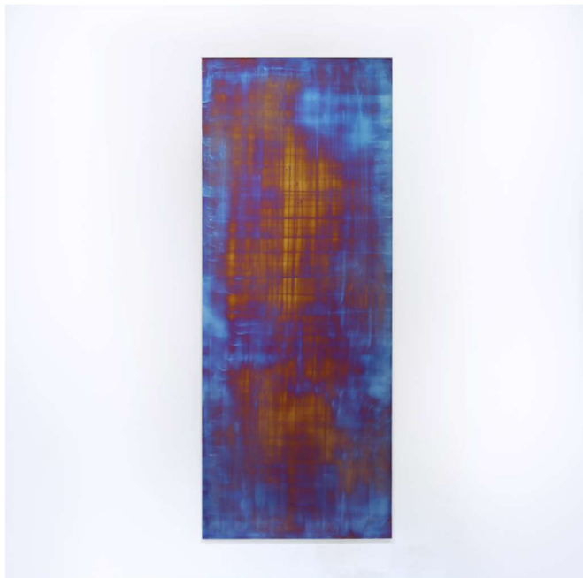
2022 937×364 mm Titanium

The amount of variation in the colors that metal itself is decided by the voltage, and for the artist to have the ability lets her build up a gradation of beautiful colors. A natural phenomenon that disappears in an instant, or the after image of memories in people's minds and so on, people who see her abstract work conjure up all kinds of memories from it and relate themselves to her pieces and understand. Furthermore, you can enjoy the changes of color in coordination with natural light or illumination, also our brain makes colors supplementary when looking at her work.