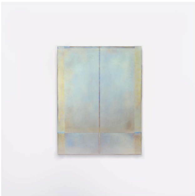
2022 486 × 375 mm Titanium

YUKI-SIS では、2022 年 9 月 10 日（土）－24 日（土）柳田有希子個展” Falling” を開催いたします。