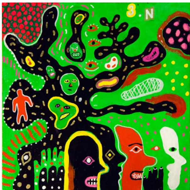
Nostalgia nesting in the hollow: if / for 2018 アクリル/アニメーション

国内では、文化庁メディア芸術祭大賞受賞作品「浮楼」、DOMANI展(2015)にて大絶賛を浴びた「É IN MOTION No.2」、そして去年のスパイラル30周年記念展「スペクトラム」で発表された「Solitarium」をはじめとするアニメーション映像作品で知られ、国内では美術館等での上映、そして海外の多数の映画祭で作品が上映され、その才能が世界で注目されるアニメーション作家です。