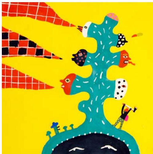
Seeding system 2018 アクリル/アニメーション