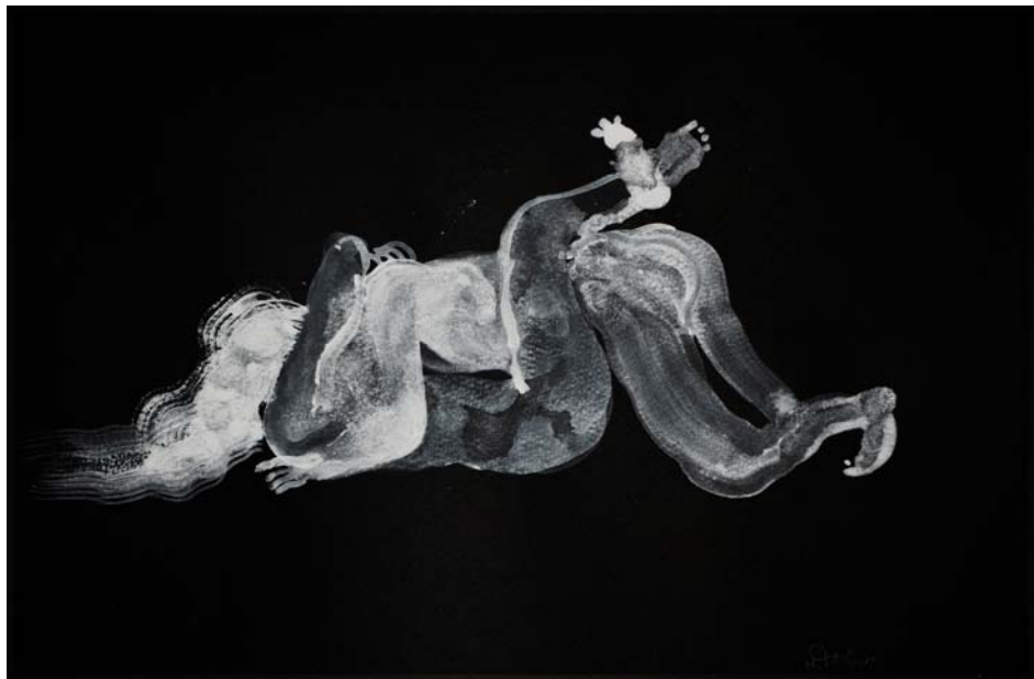
48- ashigarami- 2018 25.7×36.4 cm 紙にチタニウムホワイト、ガッシュ