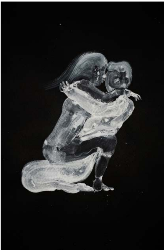
-48 negoshi- 2018 25.7×36.4 cm 紙にチタンホワイト、ガッシュ