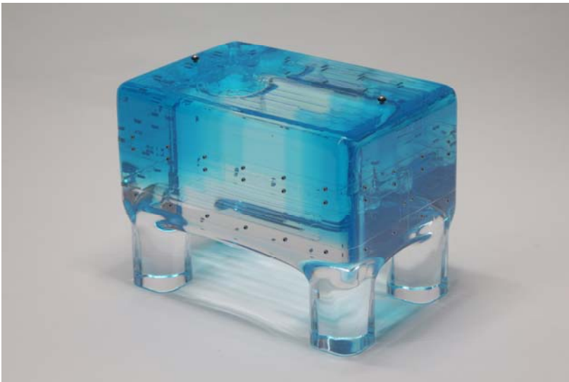
Untitled 2016 16.0x 23.0x H21.0 cm Acrylic, Oil