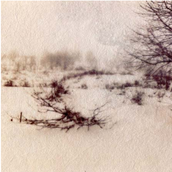
Elizabeth Leroy Neige d'encre - Ink snow 2015 Ink printing on transparent film, Acrylic painting 15.3x15.4 cm