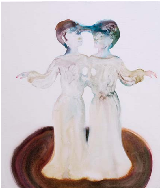
新藤杏子 Melting twins 2017