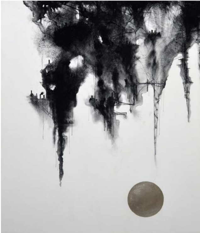
土ヶ端大介 Boundary~The sky and the city 03~ 2015 和紙・パンティストッキング・糸・顔料・銀箔 42.0 x 29.7 cm (A3)