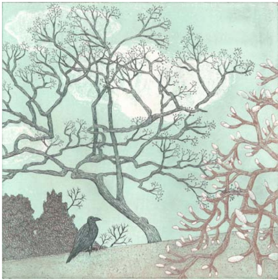
奥原しんご Hill behind 2016